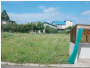
現地調査を怠りません！