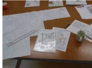
細かく資料にいたします。