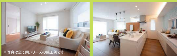
※写真は全て同シリーズの施工例です。