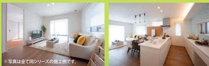
※写真は全て同シリーズの施工例です。